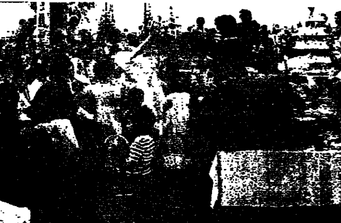
أمرح واحضالات نسي مقاهي جباع

نبدأ يروم انها هذه السنة خلاصا كانت تكون عليه كل عام تواجه كسادا في منازلها وفي مقاهيها التي تعود ابناء المنطقة على قضاء اجمل السهرات فيها، وانتخاب ملكة جمال الجنوب ويقول ابناء روم ان وضع المنطقة لم يكن كسابقا وهذا له تاثيره الكبير يضاف اليه الاوضاع المالية التي يعاني منها ابناء الجنوب بنوع خاص وعدم مجسي، المصطافين العرب الذين كان يروم منهم التصيب الاكثر. لكن هذا الوضع ليس خاصا بروم فجزين وصباح وبكاسين وحيطورة وقيتولي تعاني من